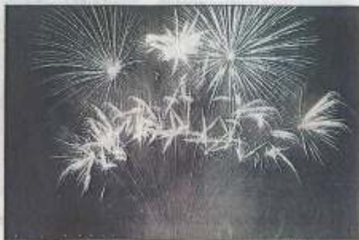
Le spectacle pyrotechnique durera un peu plus de vingt-deux minutes.

La société Loire Pyro, implantée à Bouaye, tirera samedi 2 juin, à Montoir-de-Bretagne, l'un des plus importants feux d'artifice jamais présentés dans la région. Au total, 60 000 pièces de toutes sortes (volcans, chandelles, bombes...) seront utilisées pour 22 minutes et 22 secondes de spectacle pyrotechnique et musical baptisé Danse avec le feu et signé de l'artificier Serge Guillet. À partir de ce matin, cinq camions seront nécessaires au transport de ce gigantesque feu qui nécessitera pour son installation vingt personnes pendant deux jours. Il sera implanté sur 160 mètres de façade et 240 m de profondeur.