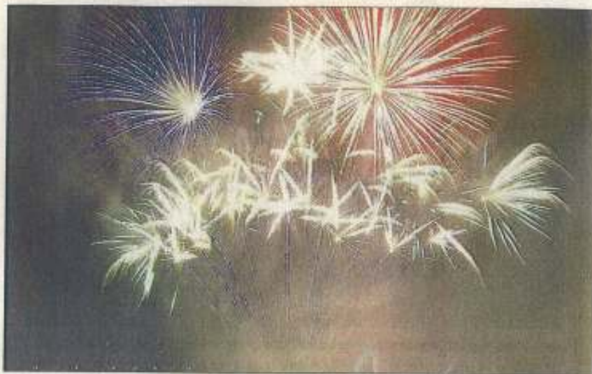
Loire Pyro tire environ 250 feux par an mais celui de Montoir-de-Bretagne prendra un caractère tout particulier et montrera le savoir faire de la société.

Depuis le complexe sportif de Bonne Source, les artificiers de cette société implantée à Bouaye vont sortir l'artillerie lourde. Très lourde, car au total il sera tiré 60 000 pièces. « évidemment aucune ne sera tirée seule afin de créer jeux et effets de lumière ». Deux portiques seront dressés pour les tirs horizontaux et latéraux, des volcans pour des gerbes de 60 mètres