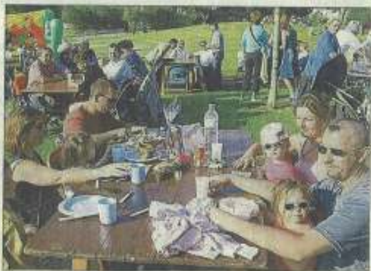
L'initiative avait reçu un accueil très favorable en 2006.

Le spectacle pyrotechnique sera tiré à partir de 23 h.