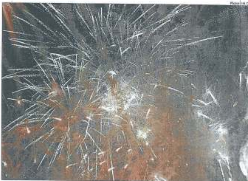
Le soleil, l'organisation sans faille, le public nombreux... : tout cela a contribué à la réussite de l'événement.

Il faut dire que les responsables de l'office socioculturel montoirain ont mis les petits plats dans les grands pour organiser et planifier ce grand rassemblement populaire, qui possède le particularisme de donner à toutes les générations de très bonnes raisons de participer à la fête.