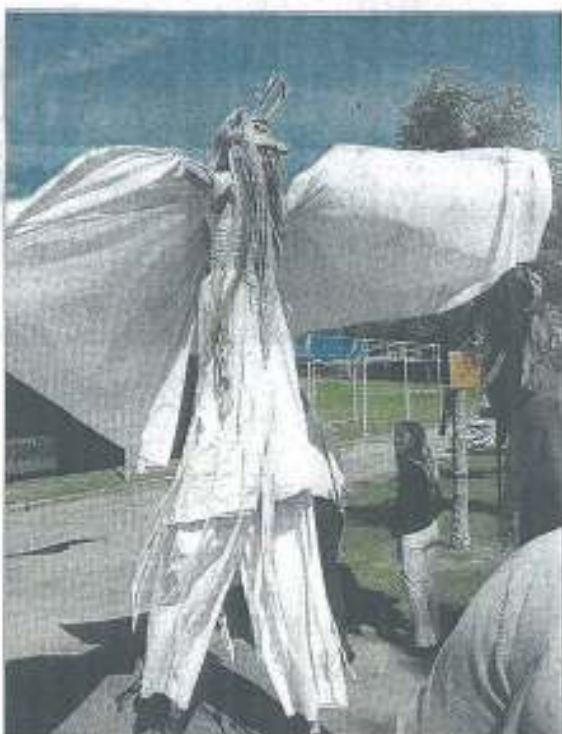
Des animations ont égayé la journée, séduisant aussi bien les petits que les grands.